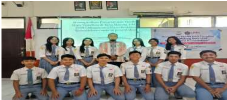
Gambar 2. Penyuluhan konflik etnis tionghoa mergosono kota malang 1945-1949

untuk membentuk pola pikir kritis dan kesadaran yang lebih baik terhadap pentingnya membangun lingkungan yang aman dan bebas dari kekerasan terhadap minoritas etnis tionghoa.