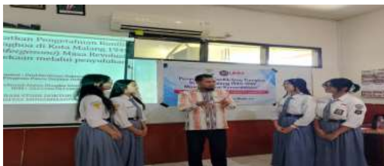
Gambar 1 .Penyuluhan konflik etnis tionghoa mergosono kota malang 1945-1949

Hal ini mengindikasikan bahwa pemahaman dengan adanya asebelum penyuluhan, diadakannya penyuluhan serta setelah ada penyuluhan adanya sebuah perbedaan pengetahuan mengenai konflik mergosono kota malang 1945-1949 lebih banyak menarik perhatian atau lebih relevan bagi kelompok perempuan, mengingat perempuan sering kali menjadi kelompok tionghoa minoritas. Namun, partisipasi laki-laki dalam kegiatan ini tetap penting karena upaya pencegahan Kekerasan terhadap minoritas tionghoa memerlukan kesadaran bersama dari semua gender. Kesadaran dan pemahaman yang lebih baik dari kedua kelompok ini dapat berkontribusi pada terciptanya lingkungan yang lebih aman dan lebih peduli terhadap kasus-kasus kekerasan terhadap etnis, ras dan suku serta antar golongan di sekolah maupun di masyarakat.