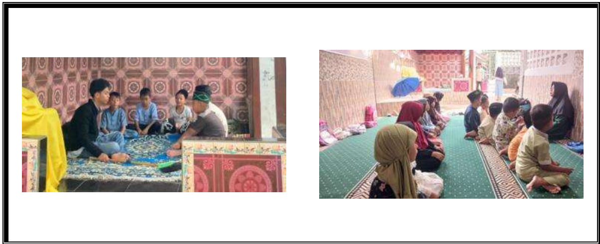
Gambar 3. Internalisasi Adab Harian dan Hadits Pendek