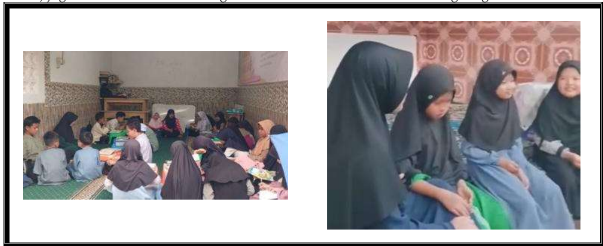
Gambar 5. Pengembangan Karakter

Keberhasilan program pencegahan pemerosotan moral tidak akan tercapai tanpa dukungan dan konsistensi dari lingkungan terdekat anak, yaitu keluarga. Oleh karena itu, kegiatan keenam difokuskan pada Kajian Orang Tua (Wali Santri). Kegiatan ini berfungsi sebagai wadah bagi Ustadz dan Ustadzah untuk membangun komitmen bersama dengan para wali santri, memastikan bahwa seluruh program dan kebiasaan yang telah diajarkan di TPA (seperti adab harian, hafalan, dan praktik Shalat) juga diamalkan dan didukung secara konsisten di rumah serta di lingkungan sekitar.