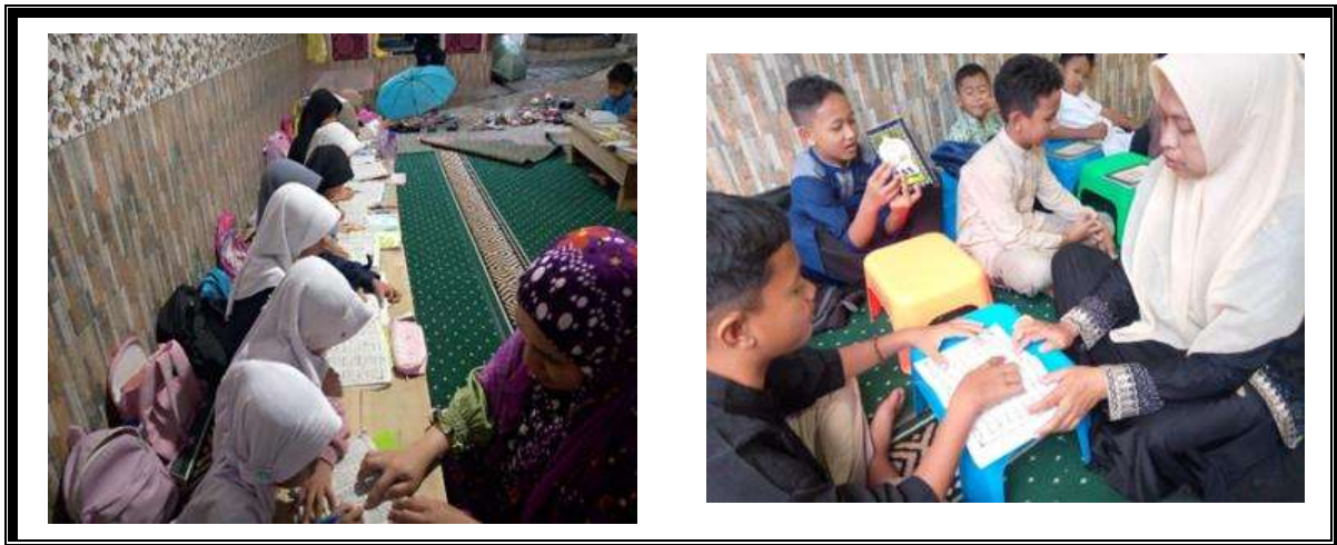
Gambar 1. Internalisasi Ilmu Tahsin dan Tajwid