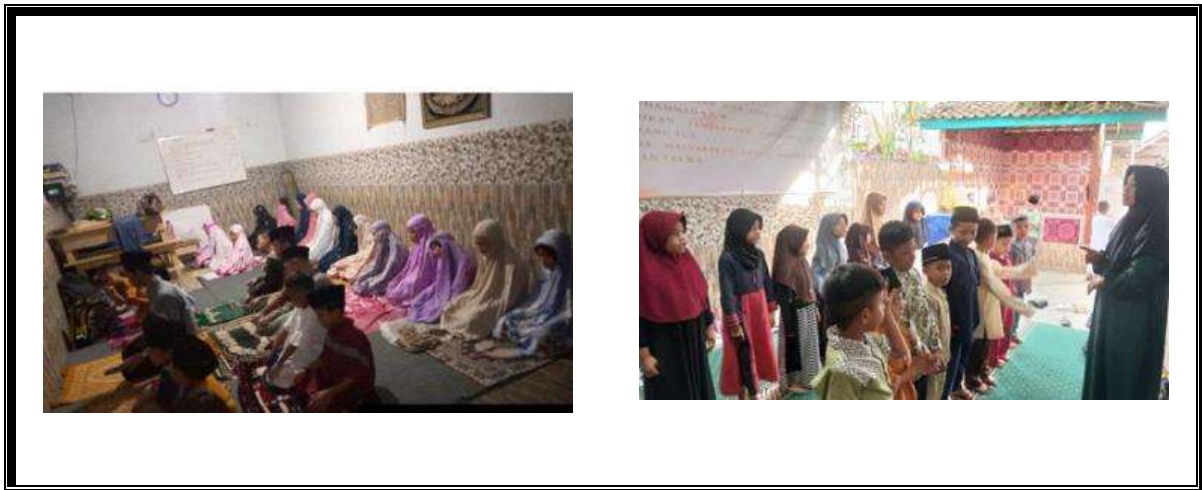
Gambar 2. Internalisasi Shalat