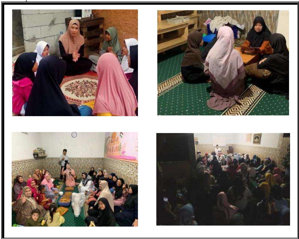
Gambar 1. Pembinaan Karakter

Selain itu, keterlibatan orang tua dan lingkungan menjadi faktor pendukung penting dalam pembentukan civics disposition di Rumah Qur'an Nurul Alwi (RUQUNA). Sinergi antara pendidik dan orang tua dalam menerapkan nilai-nilai Islami di rumah memperkuat proses internalisasi karakter anak. Konsistensi nilai antara lingkungan Rumah Qur'an Nurul Alwi (RUQUNA) dan keluarga membantu anak memahami bahwa perilaku baik tidak hanya berlaku di sekolah, tetapi juga dalam kehidupan sehari-hari. Dengan demikian, civics disposition memiliki peran strategis dalam pembentukan karakter anak di TPA Rumah Qur'an Nurul Alwi (RUQUNA) sebagai upaya pencegahan pemerosotan moral. Melalui integrasi nilai-nilai kewarganegaraan dan nilai Islami dalam program habituasi yang berkelanjutan, anak-anak dibekali karakter religius, sosial, dan moral yang kuat. Hal ini tidak hanya membentuk pribadi anak yang berakhlak mulia, tetapi juga mempersiapkan mereka menjadi warga negara yang bertanggung jawab, beretika, dan berkontribusi positif bagi masyarakat di masa depan.