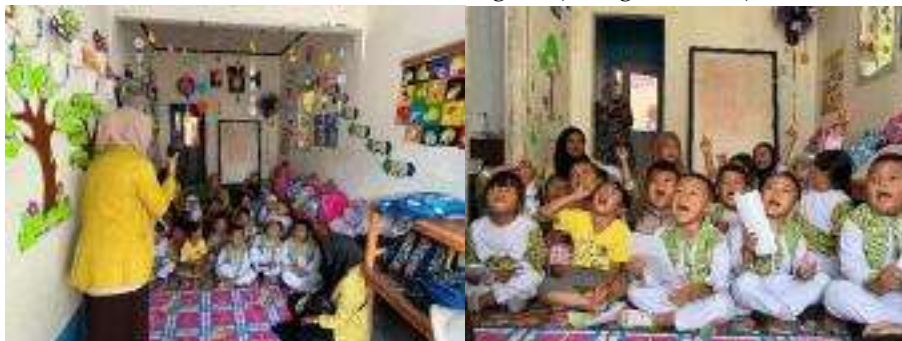
Memperingati Hari Kemerdekaan RI yang ke 79 ( 17 Agustus 2024)