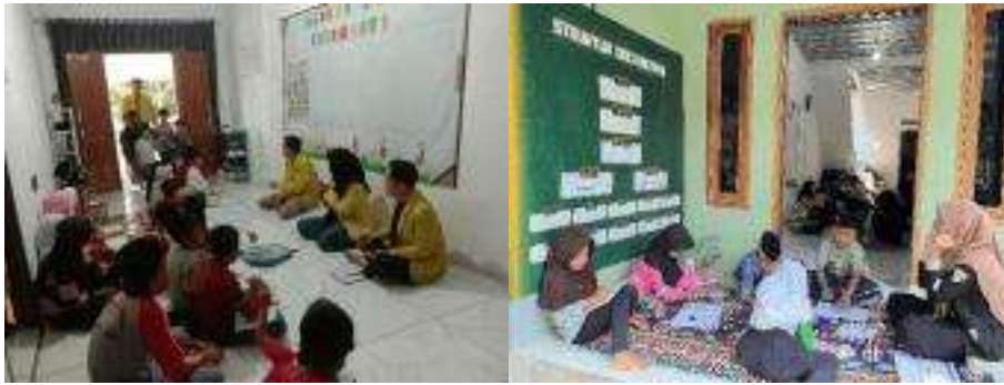
Gambar. Program Bimbingan Belajar (Bahasa Arab, Agama Islam, mengaji, dan CAlistung (12 - 30 Agustus 2024)