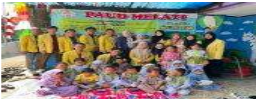
Sosialisasi "MAKanan Bergizi" (30 Agustus 2024)