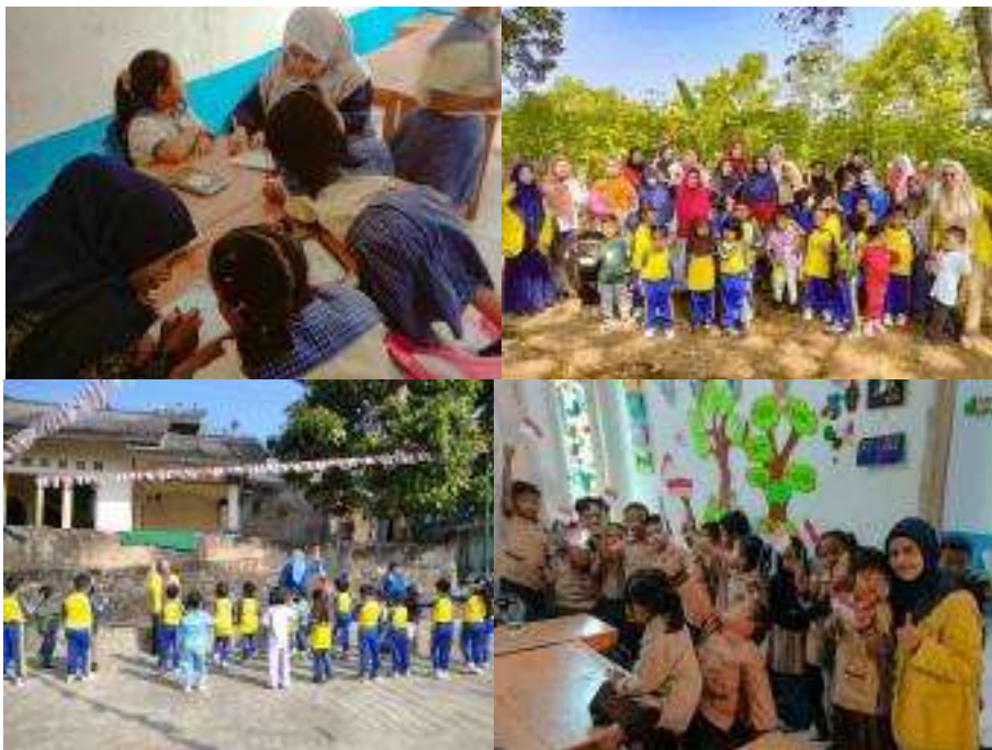
Gambar. Mengajar PAUD di wilayah Rw 05 Desa Srogol (08 - 16 Agustus 2024)