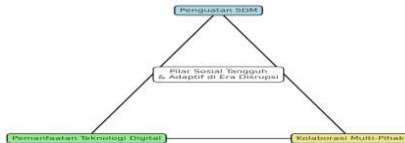
Gambar 7: Segitiga Strategi Penguatan Pilar-Pilar sosial

Kolaborasi. Tidak kalah penting adalah membangun kolaborasi multi-pihak yang melibatkan pemerintah pusat, daerah, swasta, akademisi dan masyarakat sipil. Kolaborasi ini dapat diwujudkan melalui forum koordinasi lintas sektor, kemitraan CSR, riset dan pengembangan bersama perguruan tinggi serta dukungan LSM dalam advokasi. Bryson, Crosby, & Bloomberg (2014) menekankan bahwa tata kelola berbasis public value hanya dapat dicapai melalui keterlibatan berbagai aktor yang saling melengkapi. Dengan kolaborasi ini, pilar-pilar sosial tidak bekerja sendiri, tetapi menjadi bagian dari ekosistem yang lebih besar.