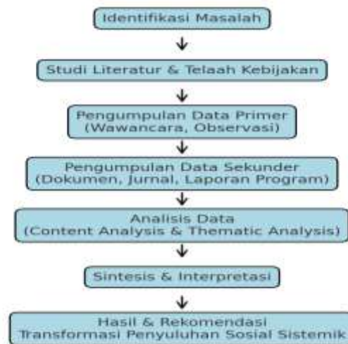
Gambar 2: Tahapan Metodologi Penelitian