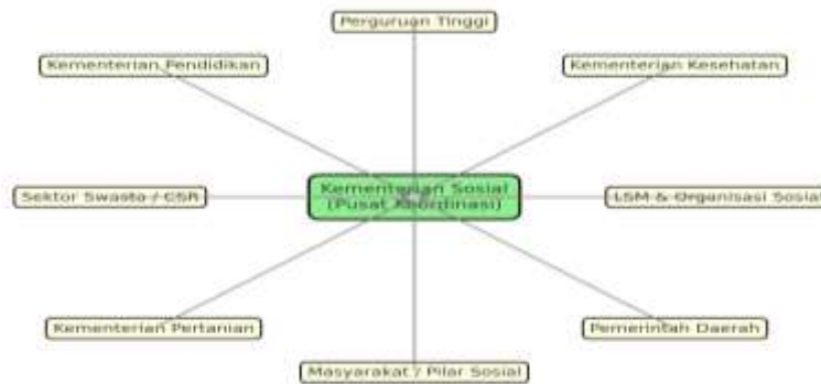
Gambar 6: Diagram Jaringan Multi-Aktor Penyuluhan sosial

Gambar 6 berupa tabel ringkas yang membandingkan antara penyuluhan sektoral dengan penyuluhan sistemik. Penyuluhan sektoral cenderung terbatas pada instansi tertentu, bersifat top-down dan berdampak parsial. Sebaliknya, penyuluhan sistemik mengedepankan koordinasi lintas sektor, melibatkan banyak aktor, menggunakan pendekatan partisipatif dan berbasis data serta menghasilkan dampak yang lebih berkelanjutan (Tabel 1). Perubahan paradigma ini penting untuk memastikan penyuluhan sosial tetap relevan di tengah perubahan era disrupsi (Head & Alford, 2015).