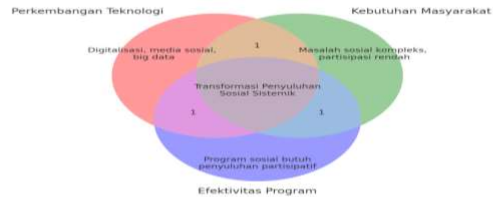
Gambar 3: Diagram Venn Urgensi Transformasi Penyuluhan Sosial

Gambar 3 Diagram Venn ini memperlihatkan tiga alasan utama urgensi transformasi penyuluhan sosial: (1) perkembangan teknologi, (2) kebutuhan masyarakat yang semakin kompleks dan (3) efektivitas program sosial. Ketiganya bertemu pada satu titik yang menunjukkan bahwa transformasi penyuluhan sosial berbasis sistemik menjadi keniscayaan untuk menjawab tantangan era disrupsi (Lestari, 2021; Sumardjo & Saharudin, 2020).