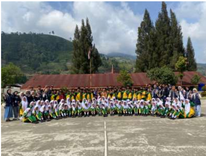
Gambar 2. Foto Bersama siswa SMPN 1 Lembang Jaya

Program sosialisasi edukatif mengenai bahaya bullying, rokok, dan penyalahgunaan narkoba dilaksanakan di SMPN 1 Lembang Jaya sebagai salah satu bentuk pengabdian masyarakat oleh mahasiswa Kuliah Kerja Nyata (KKN) Universitas Negeri Padang. Kegiatan ini bertujuan untuk meningkatkan kesadaran dan pemahaman siswa mengenai dampak negatif perilaku bullying, kebiasaan merokok, serta penyalahgunaan narkoba di lingkungan sekolah maupun dalam kehidupan sehari-hari.