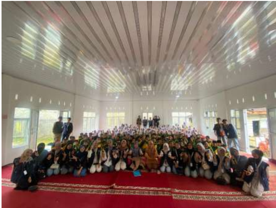
Gambar 3. Foto Bersama Saat Melaksanakan Sosialisasi

Kegiatan sosialisasi dilaksanakan secara langsung di lingkungan sekolah dengan melibatkan siswa SMPN 1 Lembang Jaya sebagai peserta utama. Pada awal kegiatan, mahasiswa memberikan pengenalan mengenai pentingnya menjaga lingkungan sekolah yang aman, sehat, dan nyaman bagi seluruh siswa. Selanjutnya, mahasiswa menyampaikan materi mengenai bullying yang mencakup pengertian bullying, bentuk-bentuk bullying, penyebab terjadinya bullying, dampak bullying terhadap korban, serta cara mencegah perilaku tersebut di lingkungan sekolah.