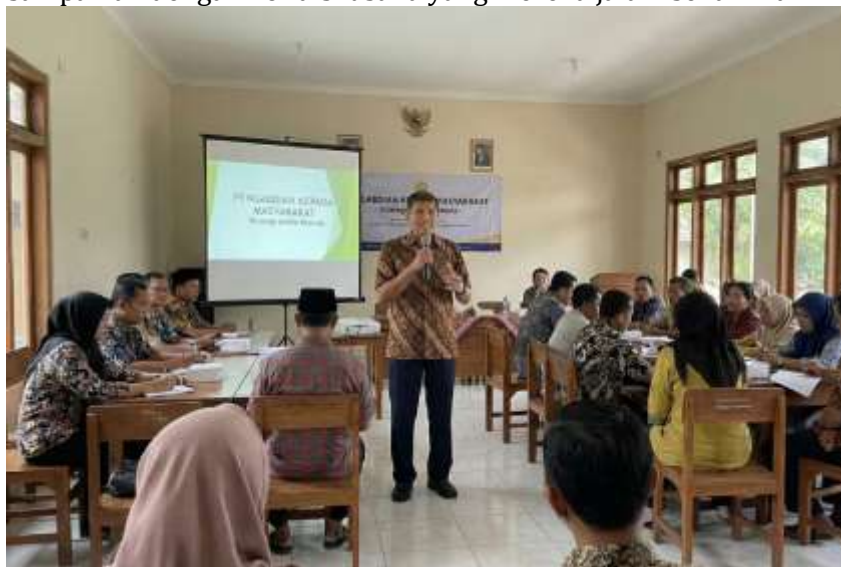
Gambar 1. Sosialisasi oleh Narasumber

Selama pelaksanaan sosialisasi, peserta tidak hanya menerima materi secara satu arah, tetapi juga dilibatkan secara aktif dalam diskusi dan sesi tanya jawab. Peserta diberikan kesempatan untuk menyampaikan permasalahan yang dihadapi dalam menjalankan usaha, seperti keterbatasan perencanaan usaha, pencampuran keuangan pribadi dan usaha, serta belum jelasnya pembagian peran antar anggota keluarga. Diskusi ini membantu peserta mengaitkan materi yang disampaikan dengan kondisi usaha yang mereka jalani sehari-hari.