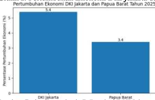
Grafik 2. Pertumbuhan Ekonomi DKI Jakarta dan Papua Barat Tahun 2025