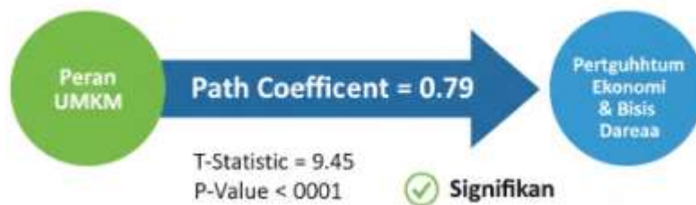
Gambar 2 Path Coefficient