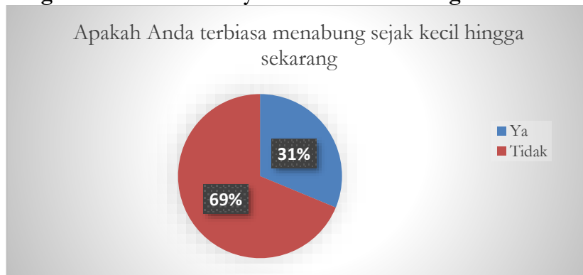
Diagram 1 Data rendahnya Perilaku Menabung