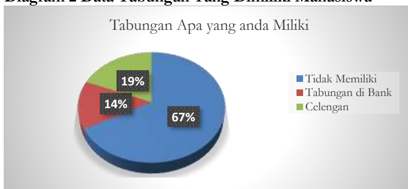
Diagram 2 Data Tabungan Yang Dimiliki Mahasiswa

Berdasarkan data pada diagram tersebut, diketahui bahwa hanya 31% responden yang terbiasa menabung sejak kecil, sementara 69% lainnya tidak memiliki kebiasaan menabung sejak dini. Temuan ini mengindikasikan masih adanya permasalahan dalam perilaku menabung di kalangan mahasiswa. Selain itu, data lain yang mendukung permasalahan ini dapat dilihat pada diagram berikut: