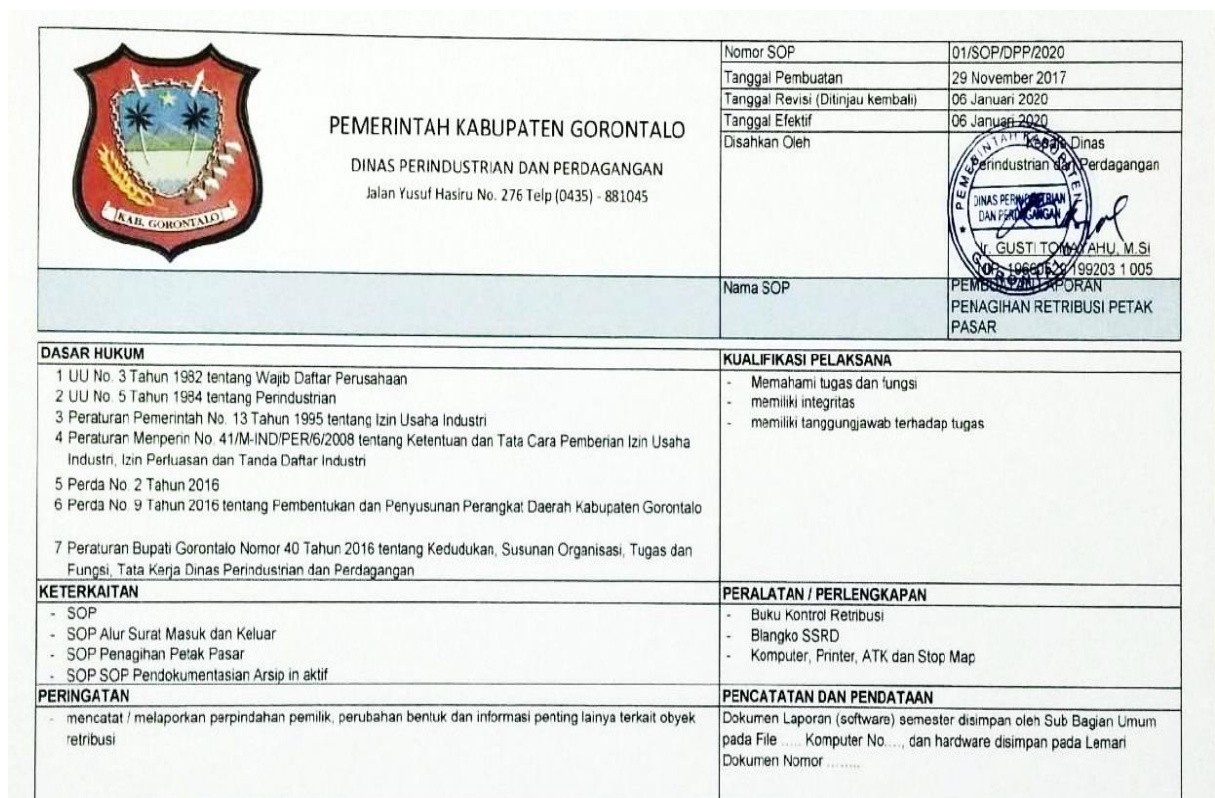
Gambar 1: tentang Dasar SOP dari Tata cara penagihan retribusi di Dinas Perindustrian dan Perdagangan Kabupaten Gorontalo

Dari beberapa pernyataan di atas dapat disimpulkan bahwa pajak daerah berasal dari pajak negara yang diserahkan kepada daerah sebagai pajak daerah. Pajak yang ditetapkan harus sesuai dengan pengertian pajak, sebagaimana dimaksud dalam pengertian pajak dalam Undang-Undang Pajak Daerah dan Retribusi Daerah.