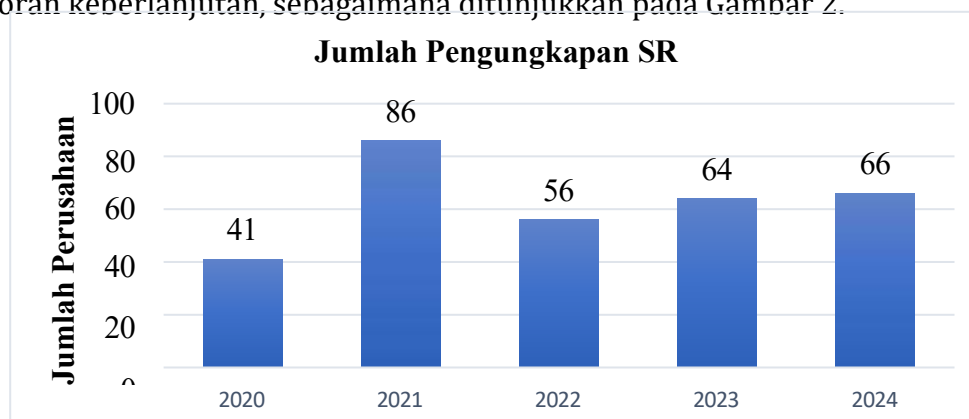
Gambar 2. Jumlah Pengungkapan Sustainability Report

Kerusakan lingkungan akibat kegiatan operasional perusahaan menjadi tanggungjawab perusahaan, selain berfokus pada profit perusahaan juga bertanggungjawab pada kelestarian lingkungan (planet) dan memenuhi kesejahteraan masyarakat di sekitar lingkungan kerja (people) (Purwanti dan Lestari, 2021). Ketiga tanggungjawab ini disebut dengan konsep Triple Bottom Line yang digunakan perusahaan sebagai pedoman untuk mengungkapkan laporan keberlanjutan atau sustainability reporting. Sustainability report berisi informasi selain kinerja keuangan perusahaan yaitu tanggung jawab perusahaan yang membuat perusahaan bertumbuh secara keberlanjutan. Pada tahun 2017 OJK mengeluarkan Peraturan OJK Nomor 51/POJK.03/2017 yang menyatakan bahwa lembaga jasa keuangan, emiten, dan perusahaan publik diwajibkan untuk menerapkan prinsip keuangan berkelanjutan, menyusun Rencana Aksi Keuangan Berkelanjutan (RAKB), dan menyampaikan Laporan Keberlanjutan untuk mendorong pembangunan keberlanjutan dan bertanggung jawab terhadap lingkungan serta masyarakat. Namun tidak semua perusahaan melaporkan laporan keberlanjutan, sebagaimana ditunjukkan pada Gambar 2.